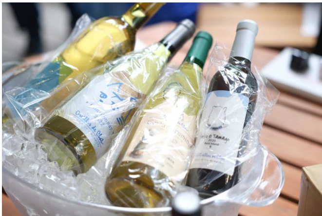
「オレイユ・ド・シャ」ワインイメージ