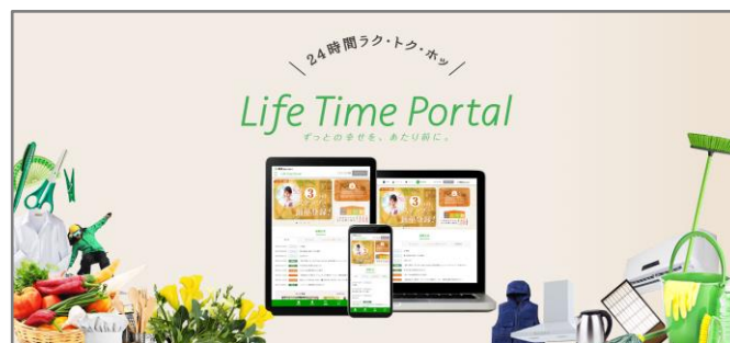
「Life Time Portal」